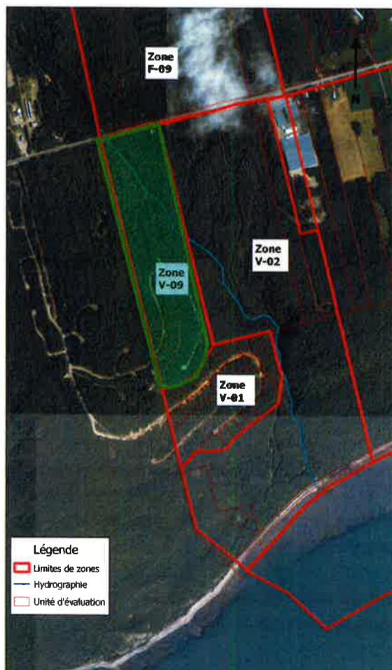
Plan de zonage des Éboulements Localisation des différentes zones dans le secteur du Domaine Charlevoix